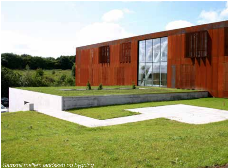
Samspil mellem landskab og bygning