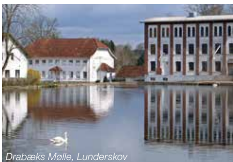
Drabæks Mølle, Lunderskov

Den gamle bygning har fået en ny anvendelse, der bevarer den både inde og ude. Det gamle giver det nye en særlig værdi og den oprindelige brug af bygningen kan stadig opleves.