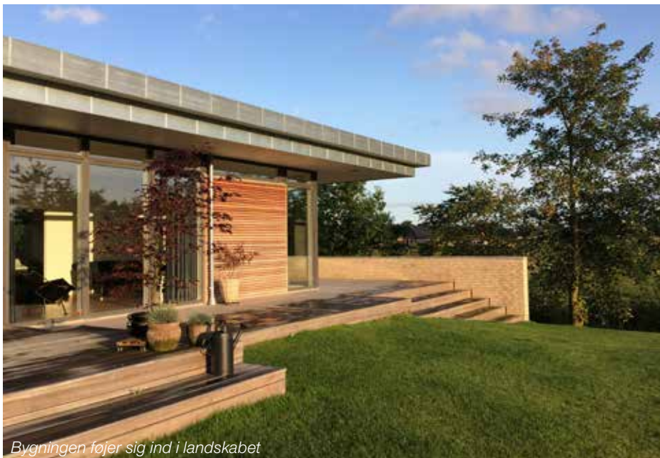
Bygningen føjer sig ind i landskabet