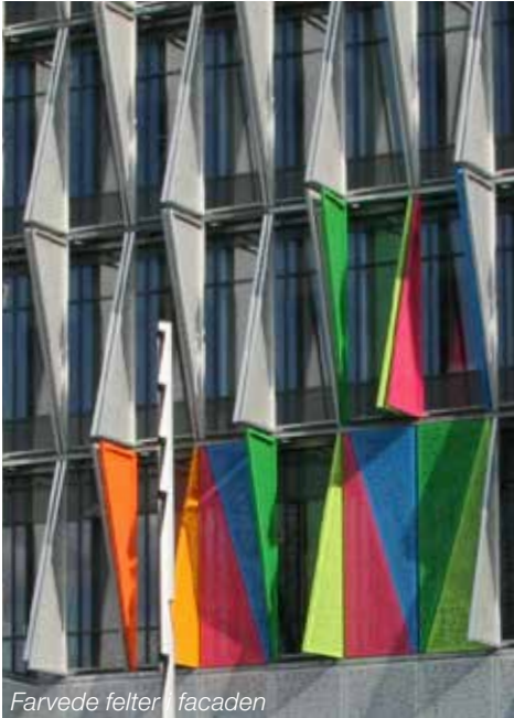
Farvede felter / facaden