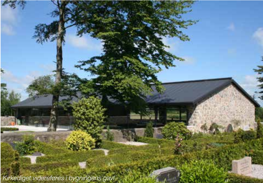
Kirkediget videreføres i bygningens gavl