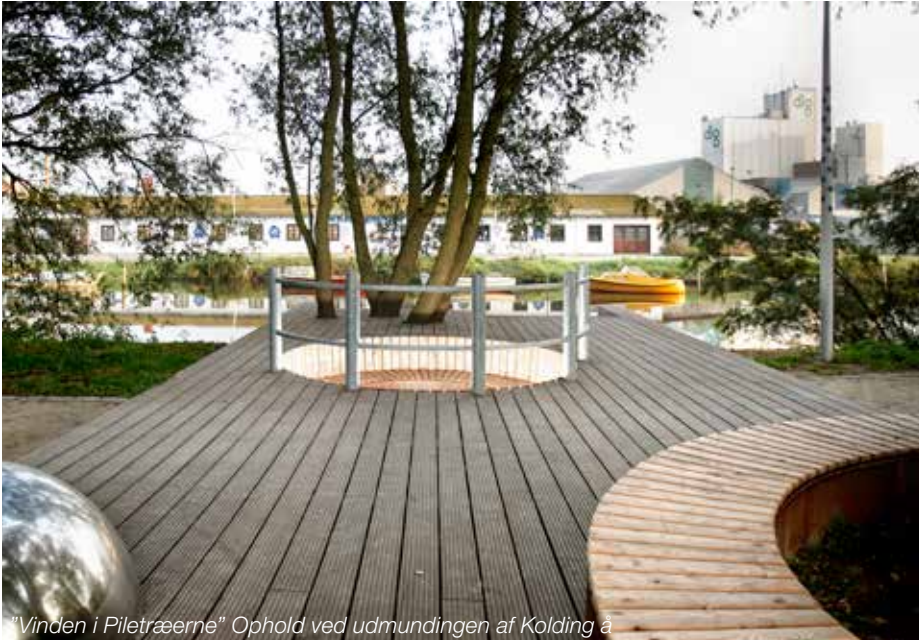
"Vinden i Piletræerne" Ophold ved udmundingen af Kolding å