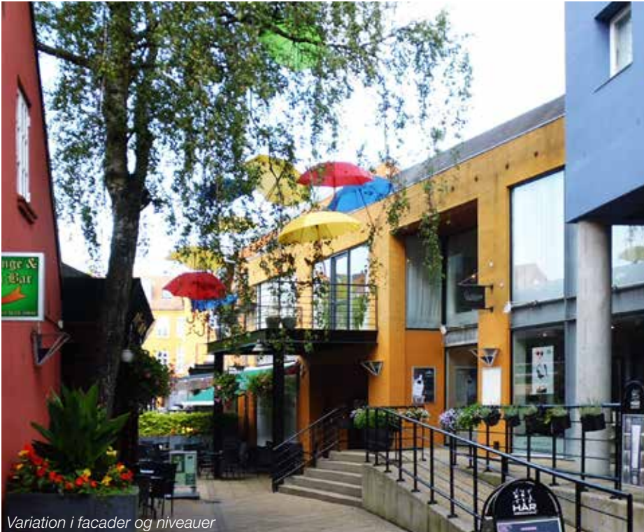
Variation i facader og niveauer