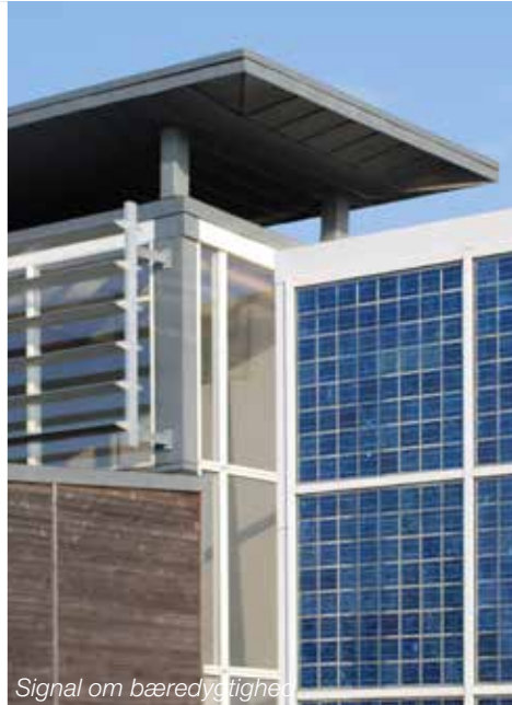
Signal om bæredygtighed