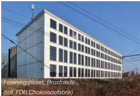
Foreningshuset, Brostræde (tidl. FDB Chokoladefabrik)

Træ er en fornybar ressource med mange gode byggetekniske egenskaber og kan være et bæredygtigt valg til mange dele af et byggeri. Her anvendt som facadebeklædning af en etageboligejendom.