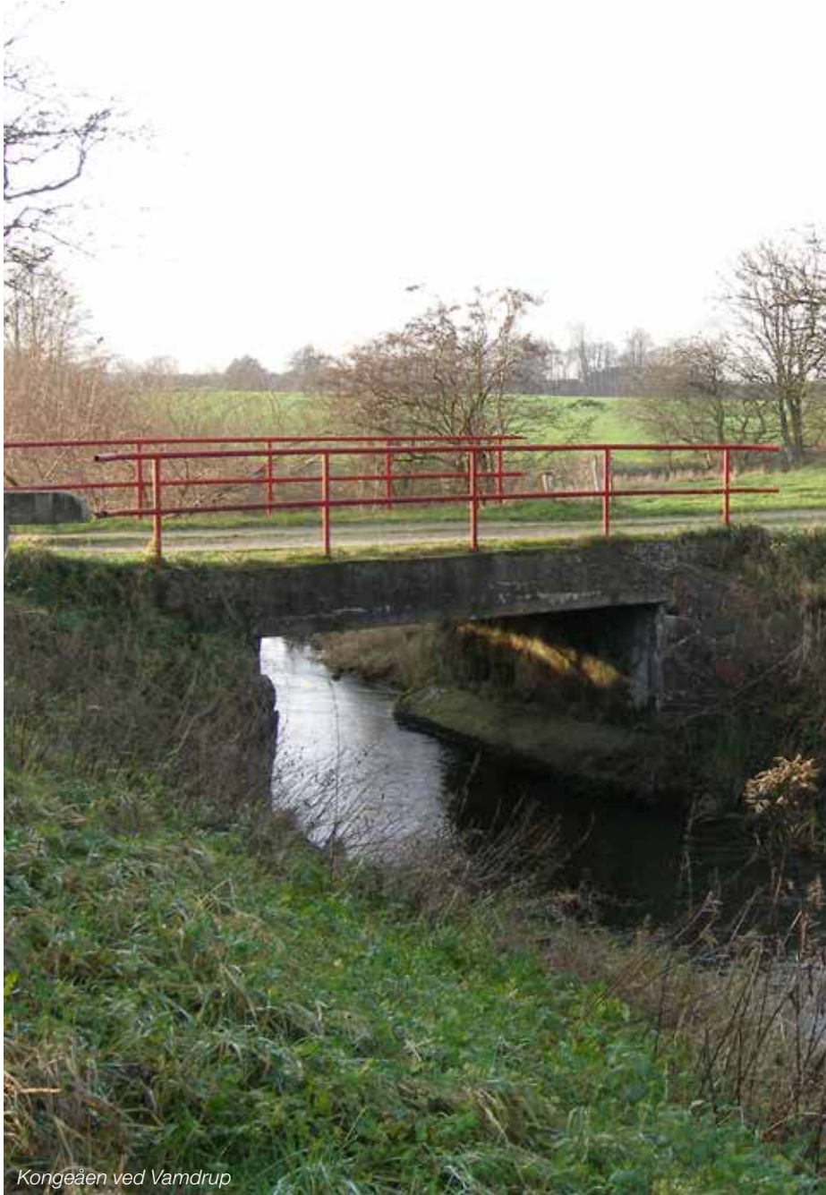
Kongeåen ved Vamdrup