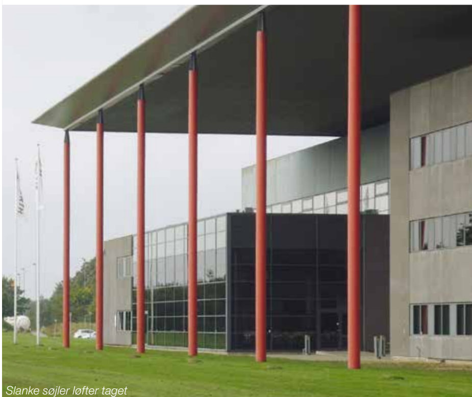
Slanke søjler løfter taget