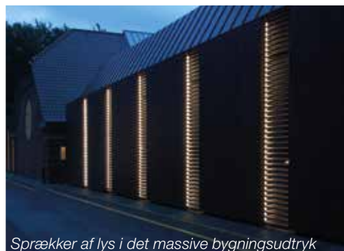
Sprækker af lys i det massive bygningsudtryk