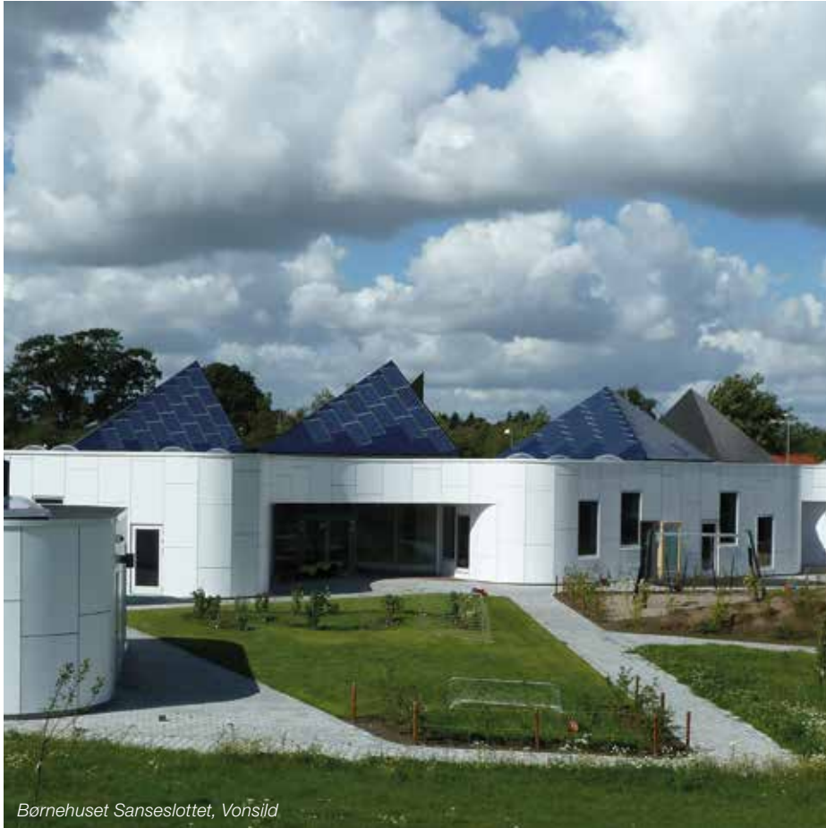
Børnehuset Sanseslottet, Vonsild