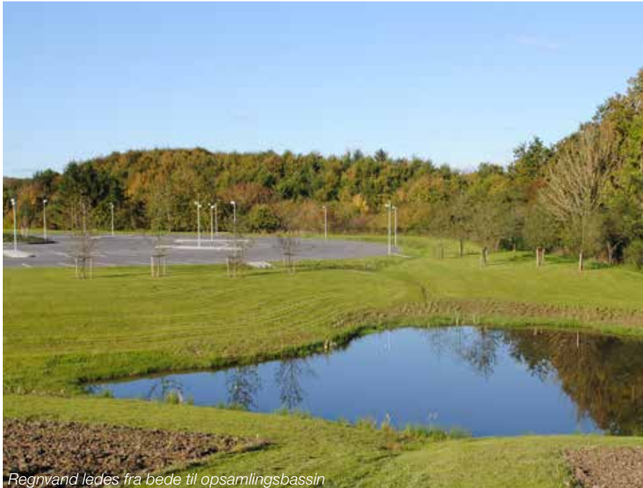
Regnvand ledes fra bede til opsamlingsbassin