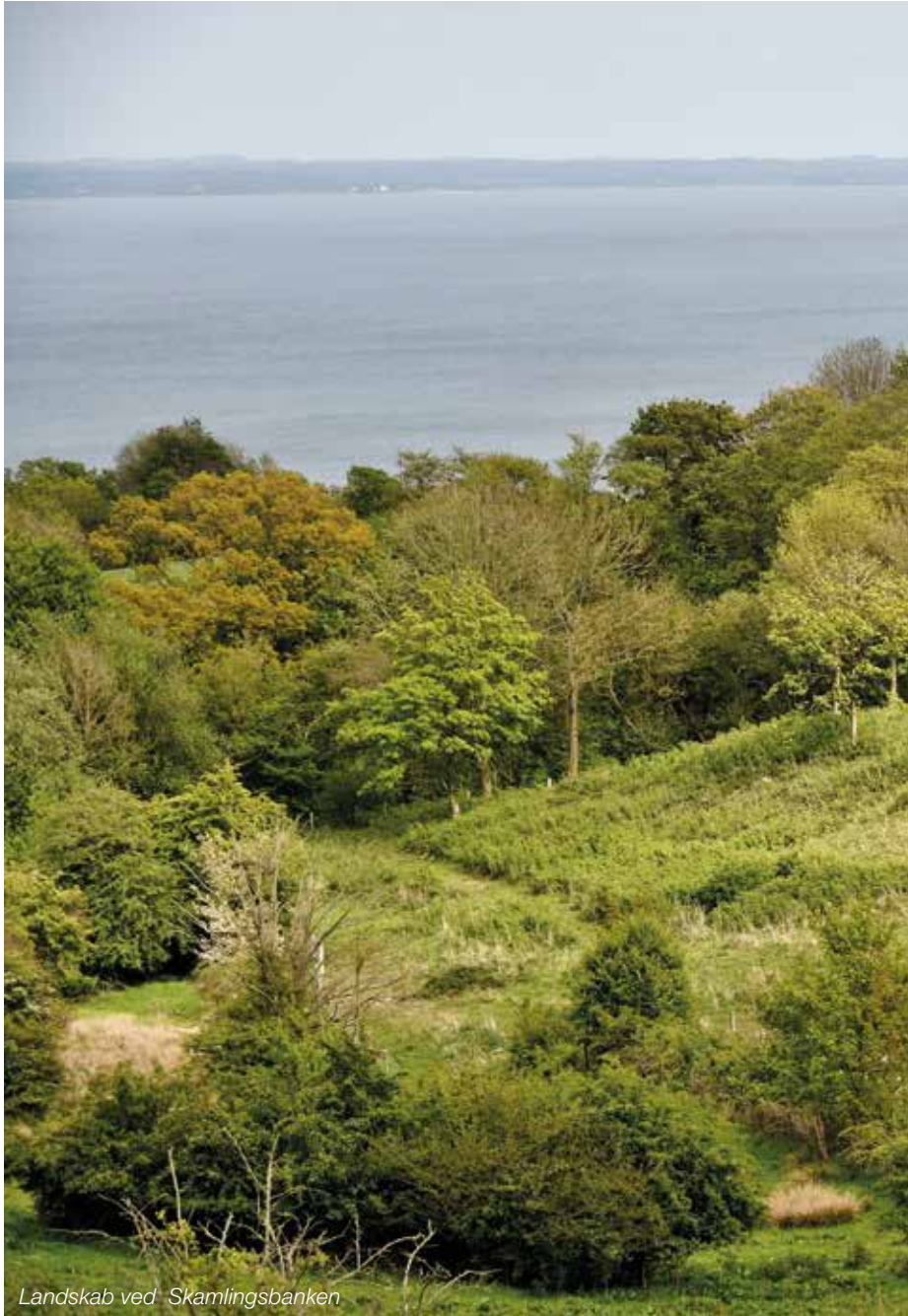
Landskab ved Skamlingsbanken