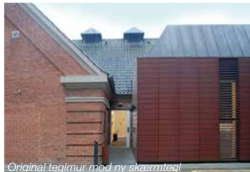
Original teglmur mod ny skærmtegl