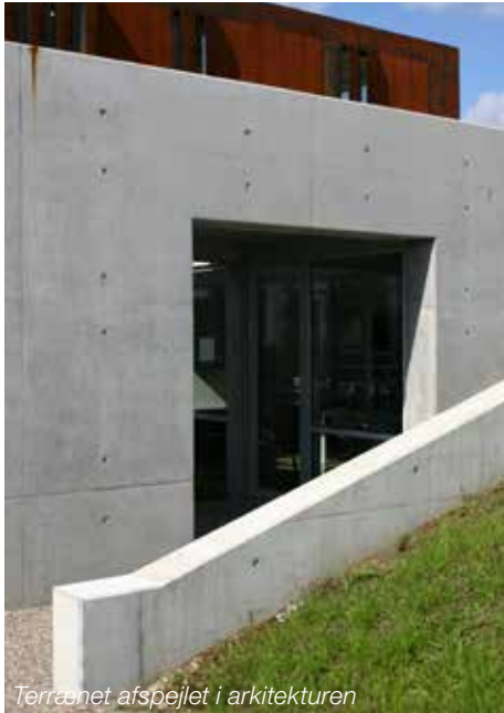
Terrænet afspejlet i arkitekturen