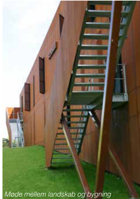
Møde mellem landskab og bygning