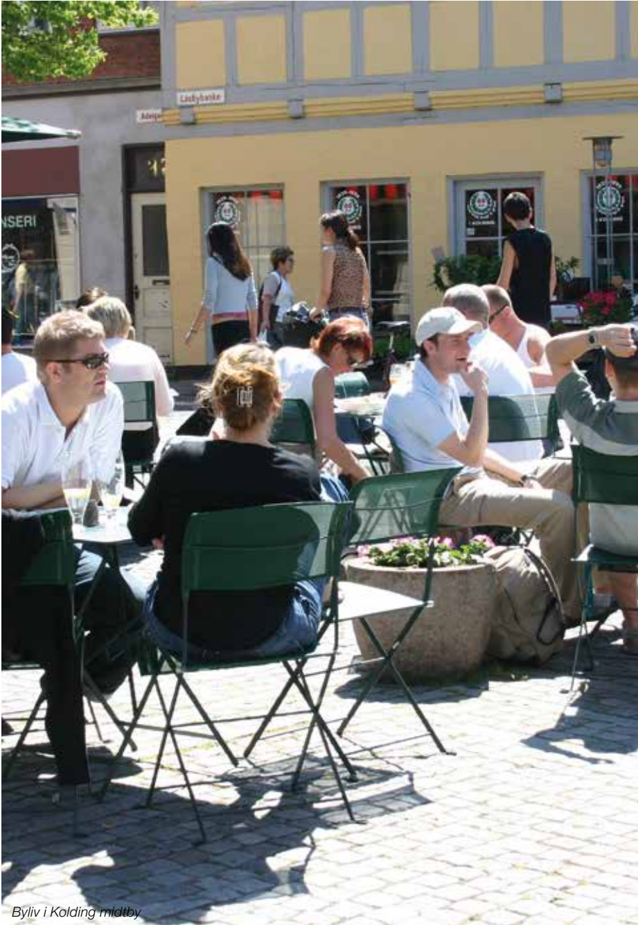
Byliv i Kolding midtby