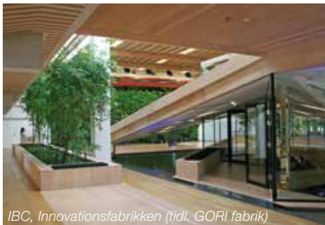
IBC, Innovationsfabrikken (tidl. GORI fabrik)

En gennemgribende renovering med bl.a. udvendig efterisolering, der nedsætter energiforbruget og beskytter den eksisterende betonkonstruktion, sikrer brug og levetid, for en historisk vigtig bygning, i mange år frem.