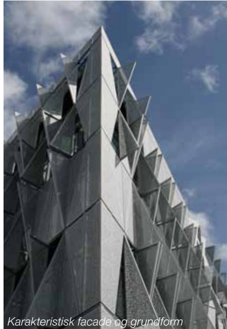
Karakteristisk facade og grundform