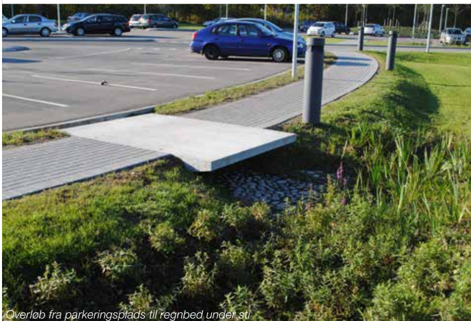
Overløb fra parkeringsplads til regnbed under sti