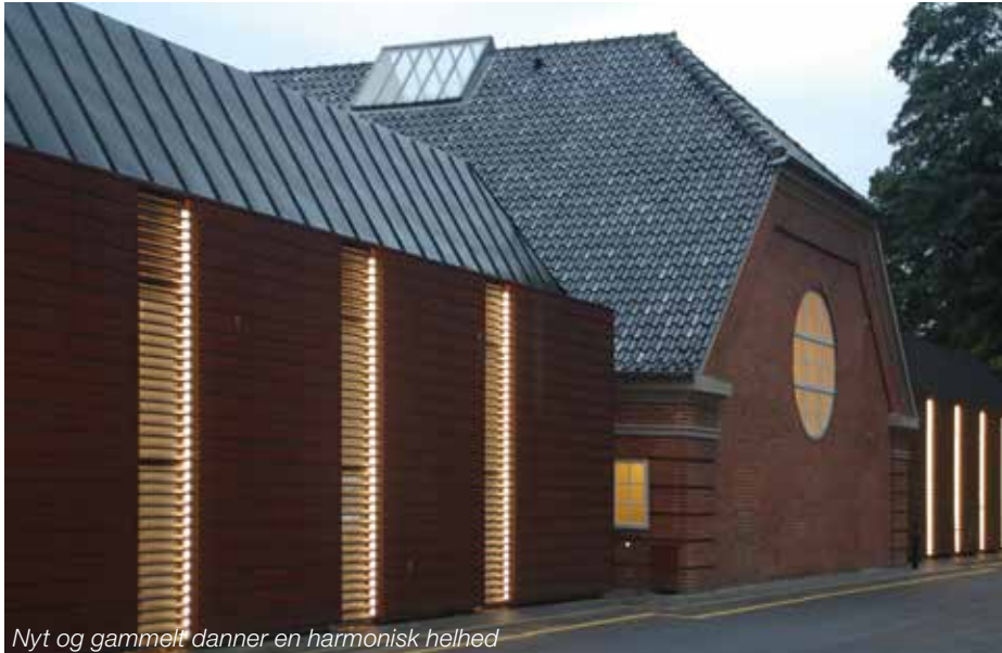
Nyt og gammelt danner en harmonisk helhed