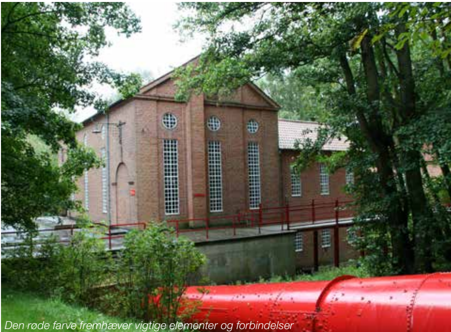
Den røde farve fremhæver vigtige elementer og forbindelser