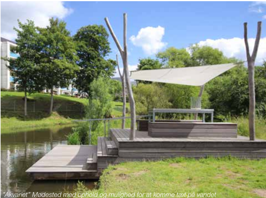
"Akvariet" Mødested med ophold og mulighed for at komme tæt på vandet