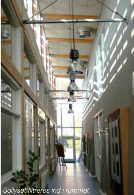
Sollyset filtreres ind i rummet