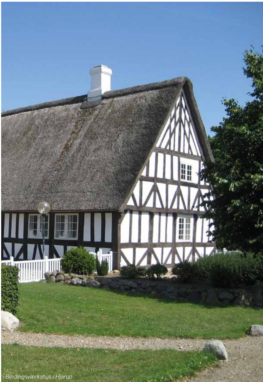
Bindingsværkshuset i Hjarup