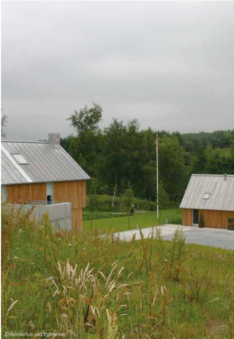
Enfamiliehus ved Egtvedvej