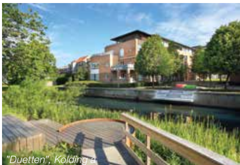
"Duetten", Kolding å

Arkitekturen tillader indblik og giver plads til ophold, både for få eller for mange.