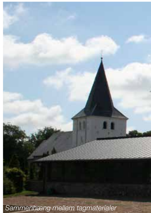
Sammenhæng mellem tagmaterialer