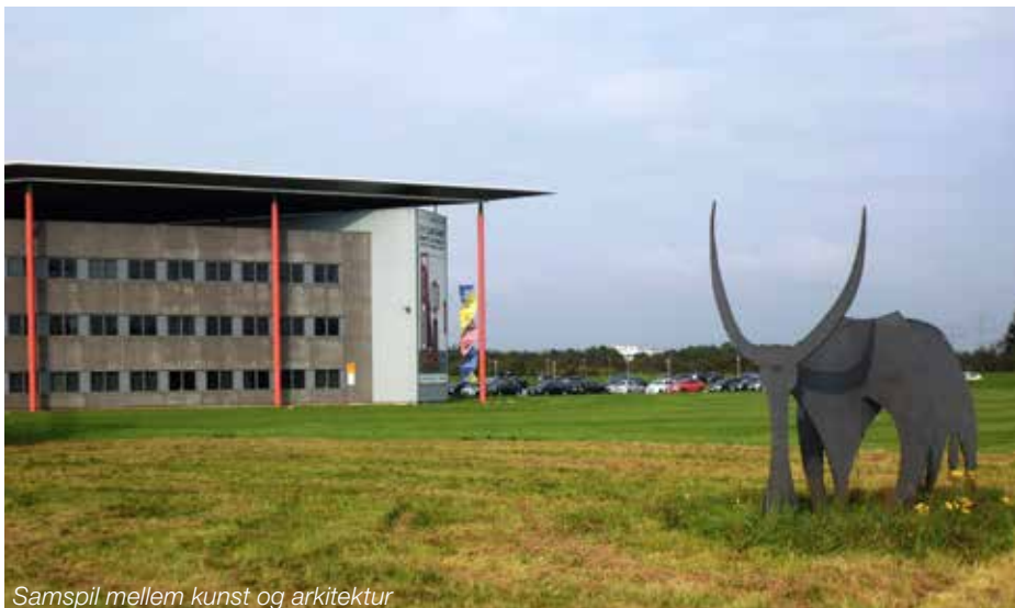
Samspil mellem kunst og arkitektur