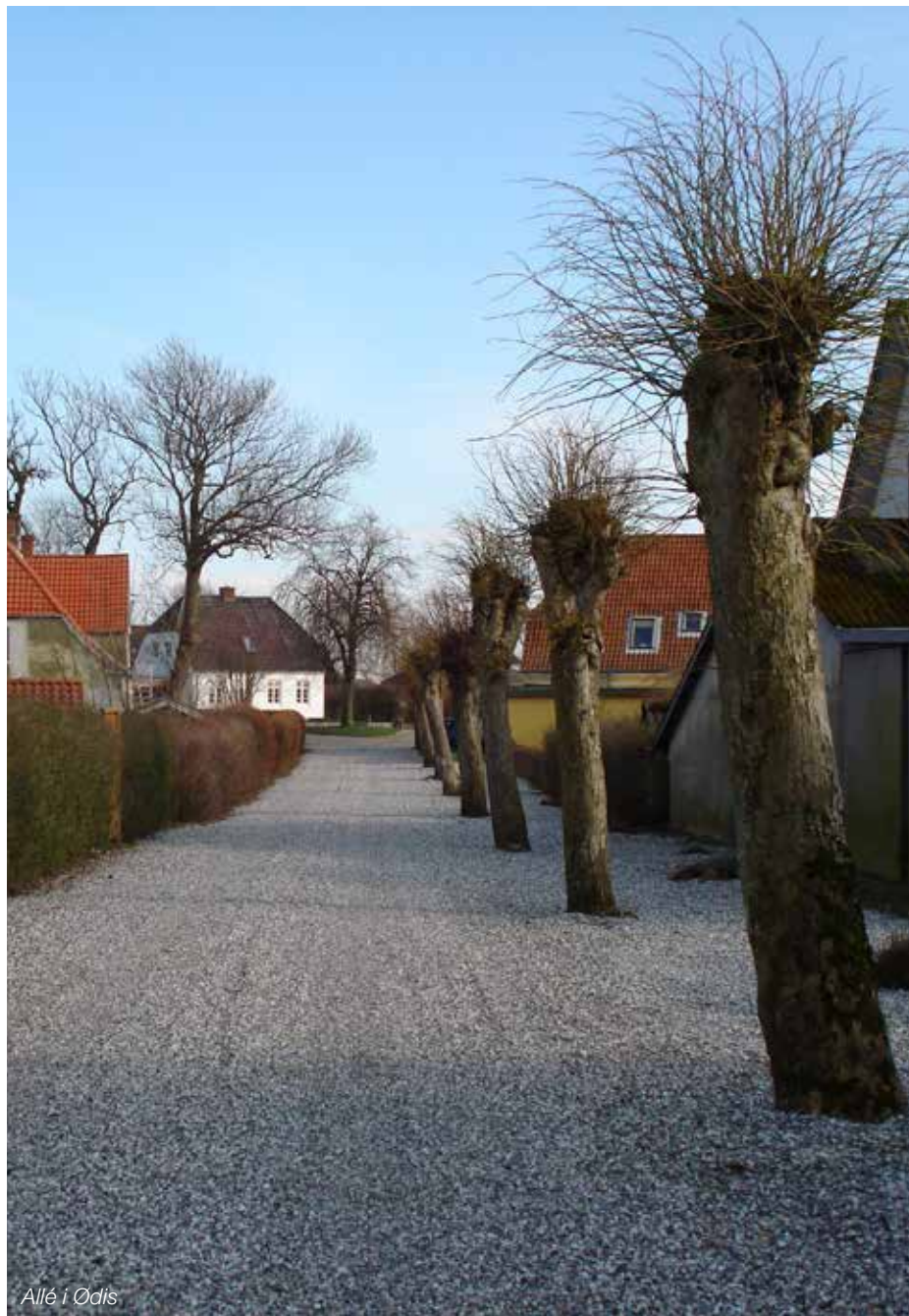
Allé i Ødis