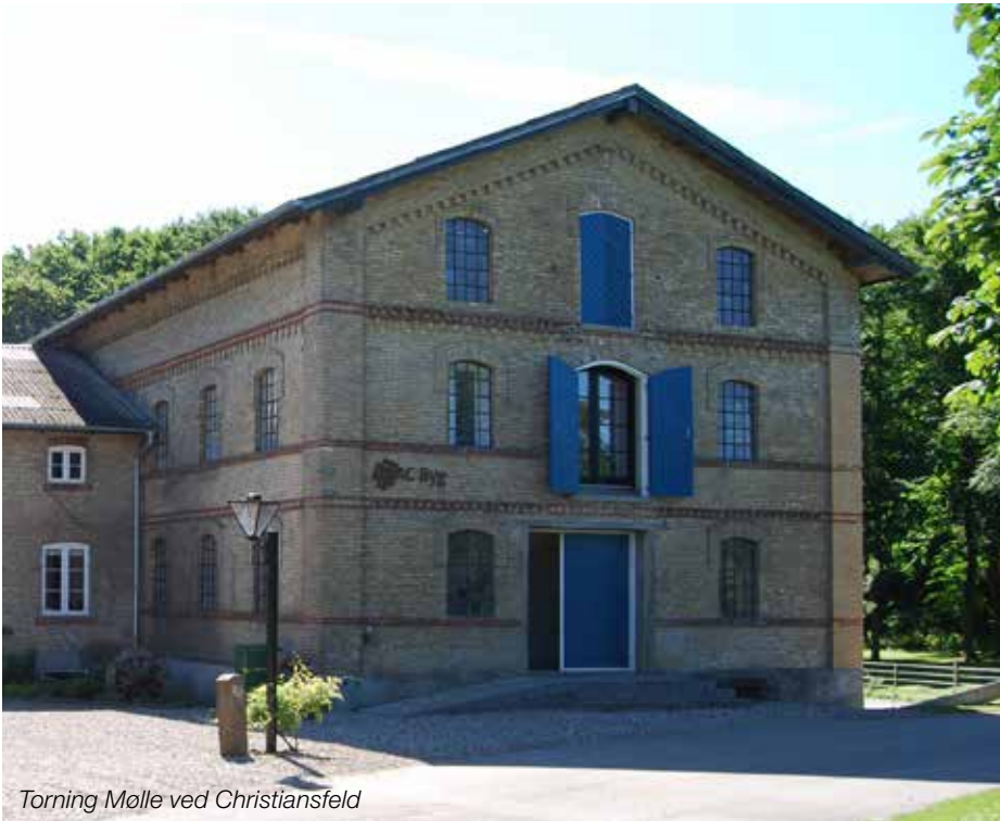
Torning Mølle ved Christiansfeld