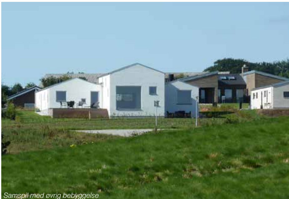
Samspil med øvrig bebyggelse