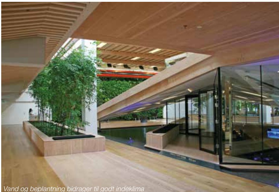
Vand og beplantning bidrager til godt indeklima