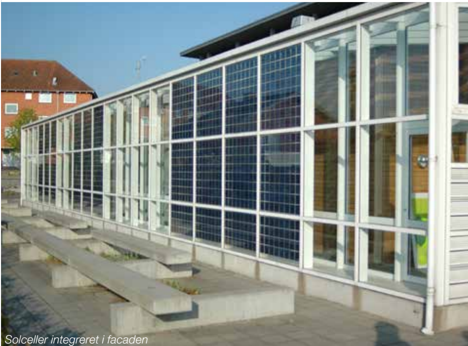
Solceller integreret i facaden