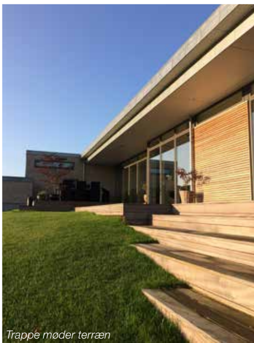
Trappé møder terræn