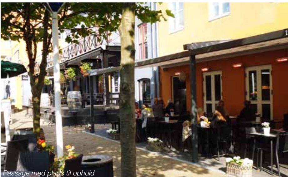
Passage med plads til ophold