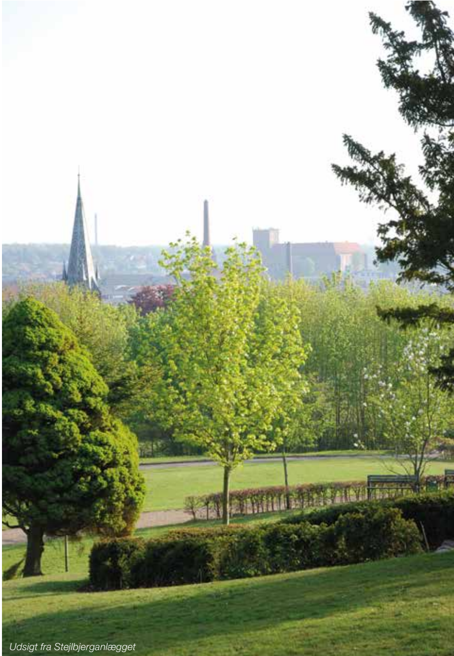
Udsigt fra Stejlbjerganlægget