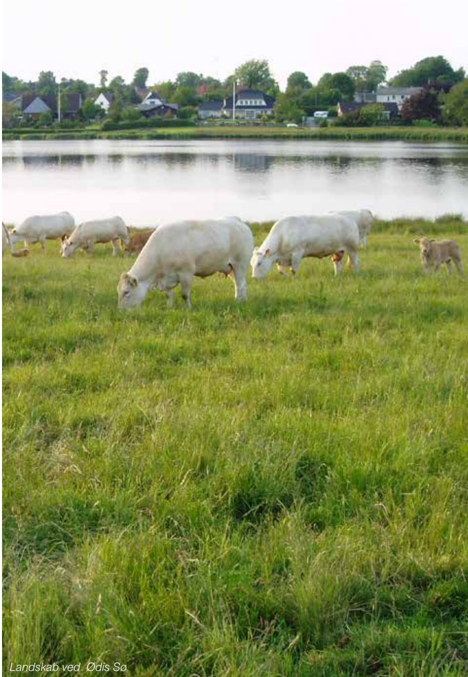
Landskab ved Ødis Sø

bevare de eksisterende kvaliteter og skabe flere værdifulde steder. Kommunens værdifulde landskaber, særligt geologiske beskyttelsesområder og kulturhistoriske værdier fremgår af Kommuneplanen.