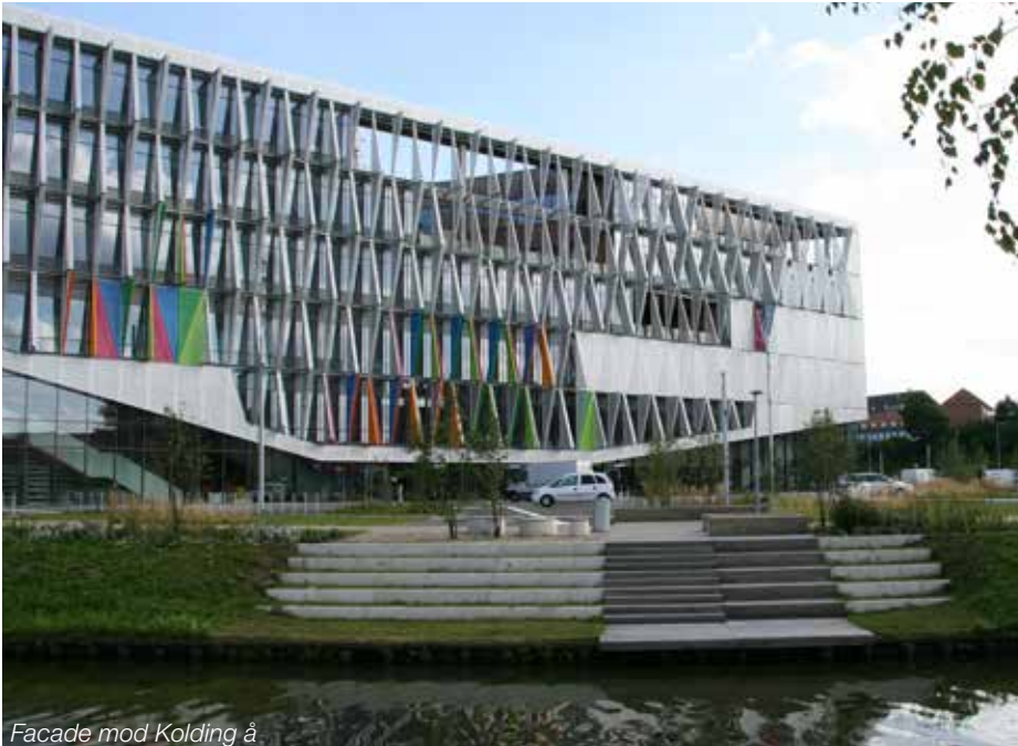
Facade mod Kolding å