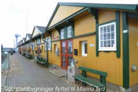
Tidl. staldbygninger flyttet til Marina syd

Sammenhængen mellem bygninger og stedet er unik. Den helhed, de danner, er afgørende for forståelsen og værdien af stedet.