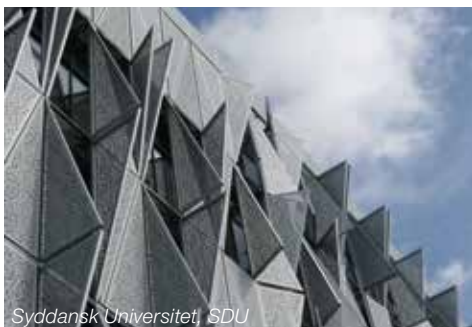
Syddansk Universitet, SDU

Det nye byggeris formsprog, materialer og farver tager udgangspunkt i den eksisterende arkitektur.