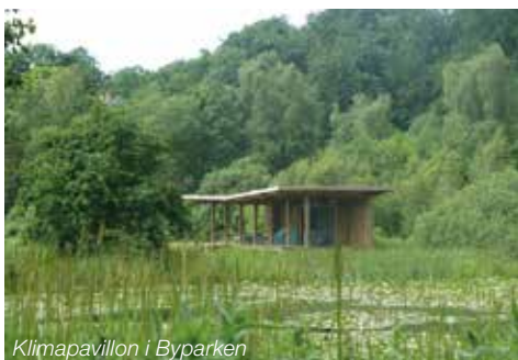
Klimapavillon i Byparken

Arkitekturens geometriske udtryk skiller sig ud fra omgivelserne.