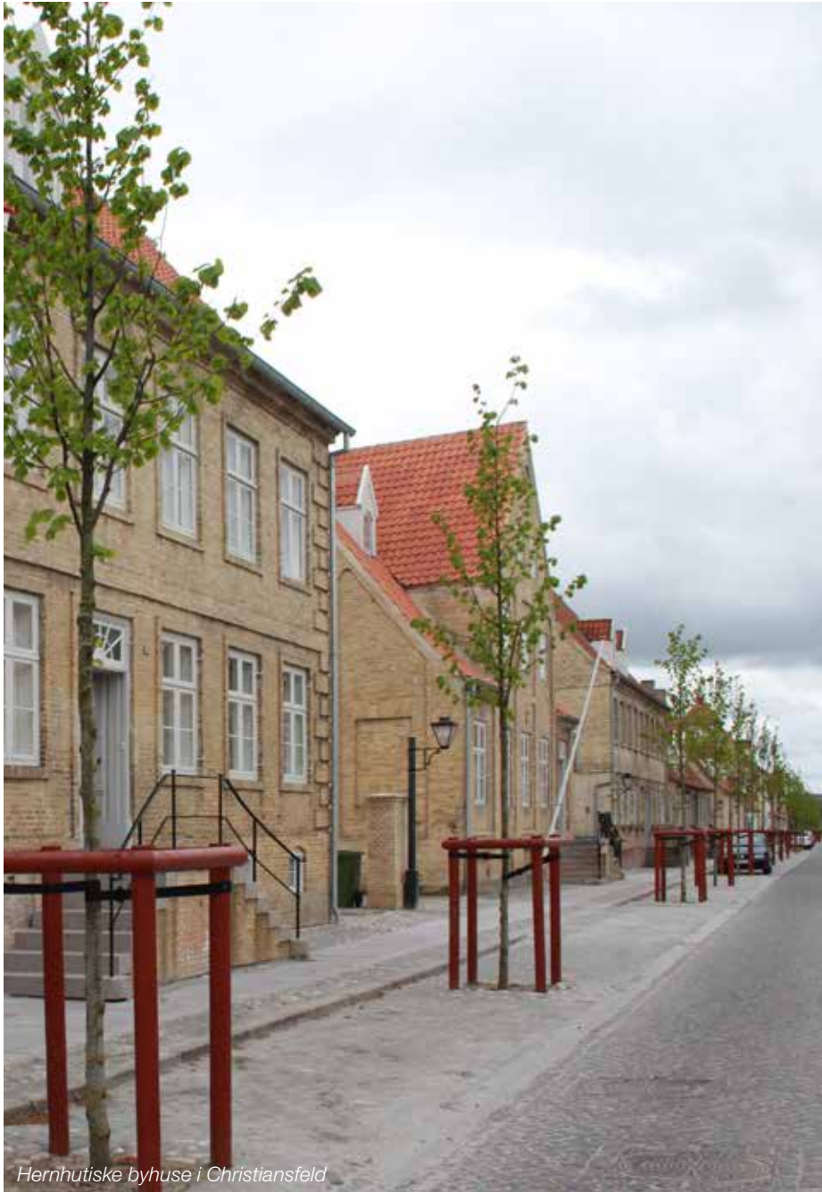
Herrnhutiske byhuse i Christiansfeld