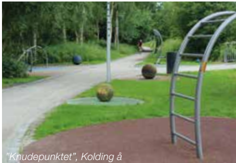
"Knudepunktet", Kolding å

De indendørs aktiviteter og tilbud er synlige igennem den transparente facade.