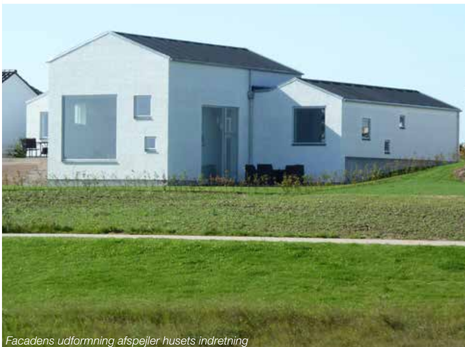
Facadens udformning afspejler husets indretning