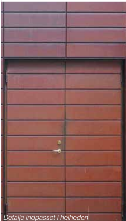
Detalje indpasset i helheden