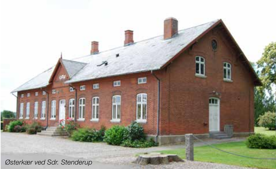
Østerkær ved Sdr. Stenderup