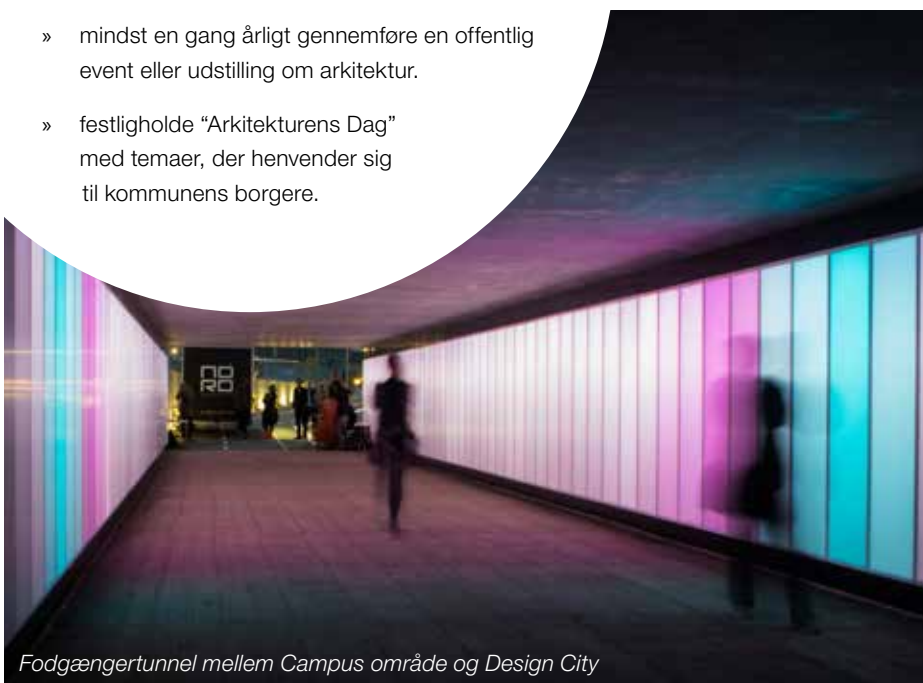
Fodgængertunnel mellem Campus område og Design City