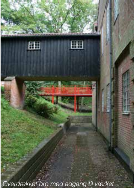
Overdækket bro med adgang til værket